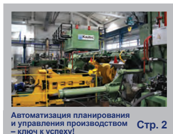
Автоматизация планирования и управления производством — ключ к успеху!