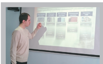
Профессиональный уровень молодых специалистов растет