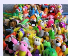
Сотрудники СИАЛа собрали 300 игрушек для детских домов