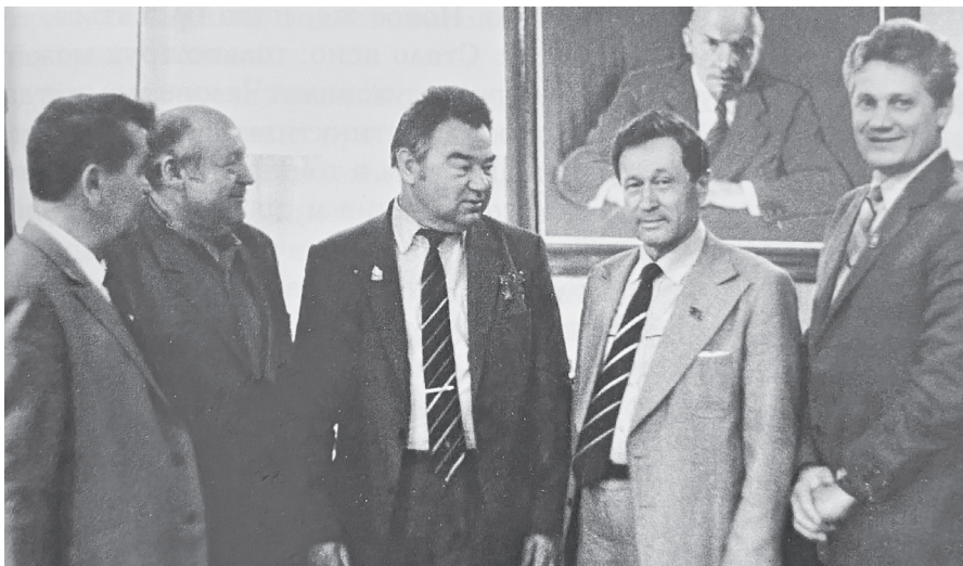
Визит на КраМЗ Героя СССР, космонавта Гречко Г.М.