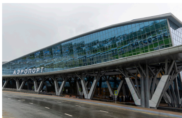
Аэропорт, г. Южно-Сахалинск

Силами коллектива «СК» ДАК» и отдела регионального проектирования «ЛПЗ «Сегал» были воплощены в жизнь задумки архитекторов и проектировщиков: аэропорты, спортивные комплексы и другие стратегически важные сооружения.