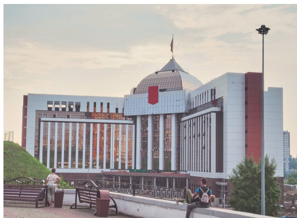
8-й кассационный суд, г. Кемерово