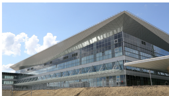
Аэропорт, г. Красноярск