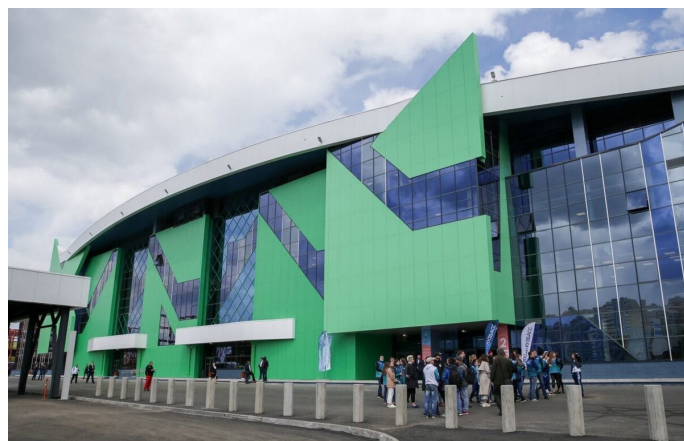
Ледовый дворец «Кузбасс», г. Кемерово

На сегодняшний день компания «СК «ДАК» возводит: